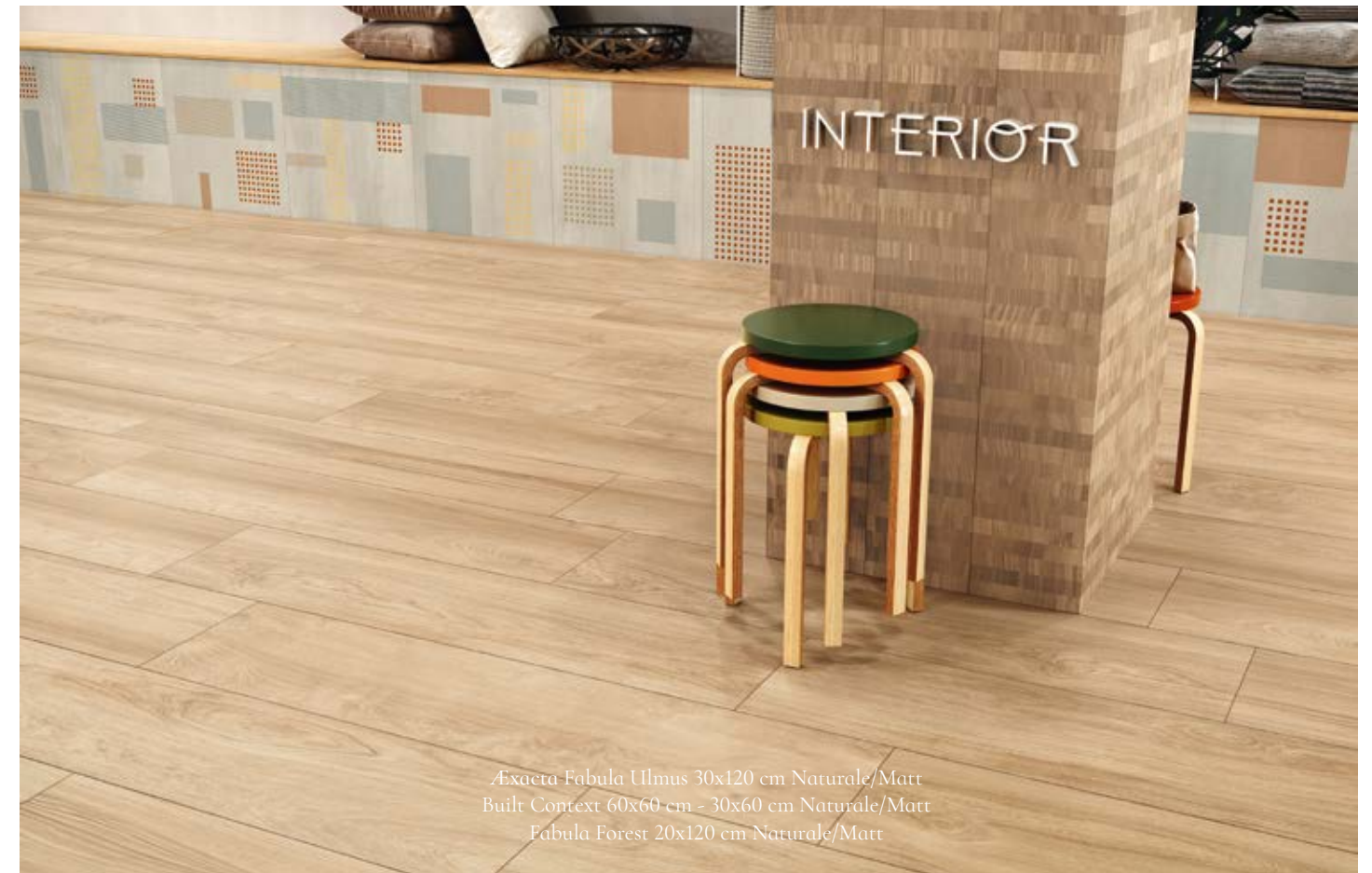
Exacta Fabula Ulmus 30x120 cm Naturale/Matt Built Context 60x60 cm - 30x60 cm Naturale/Matt Fabula Forest 20x120 cm Naturale/Matt