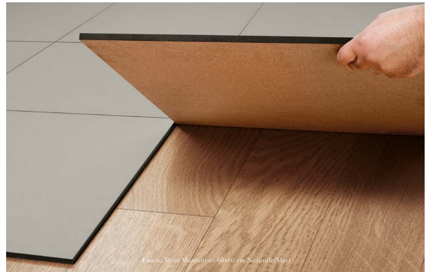
Exacta More Manhattan 60x60 cm Naturale/Matt