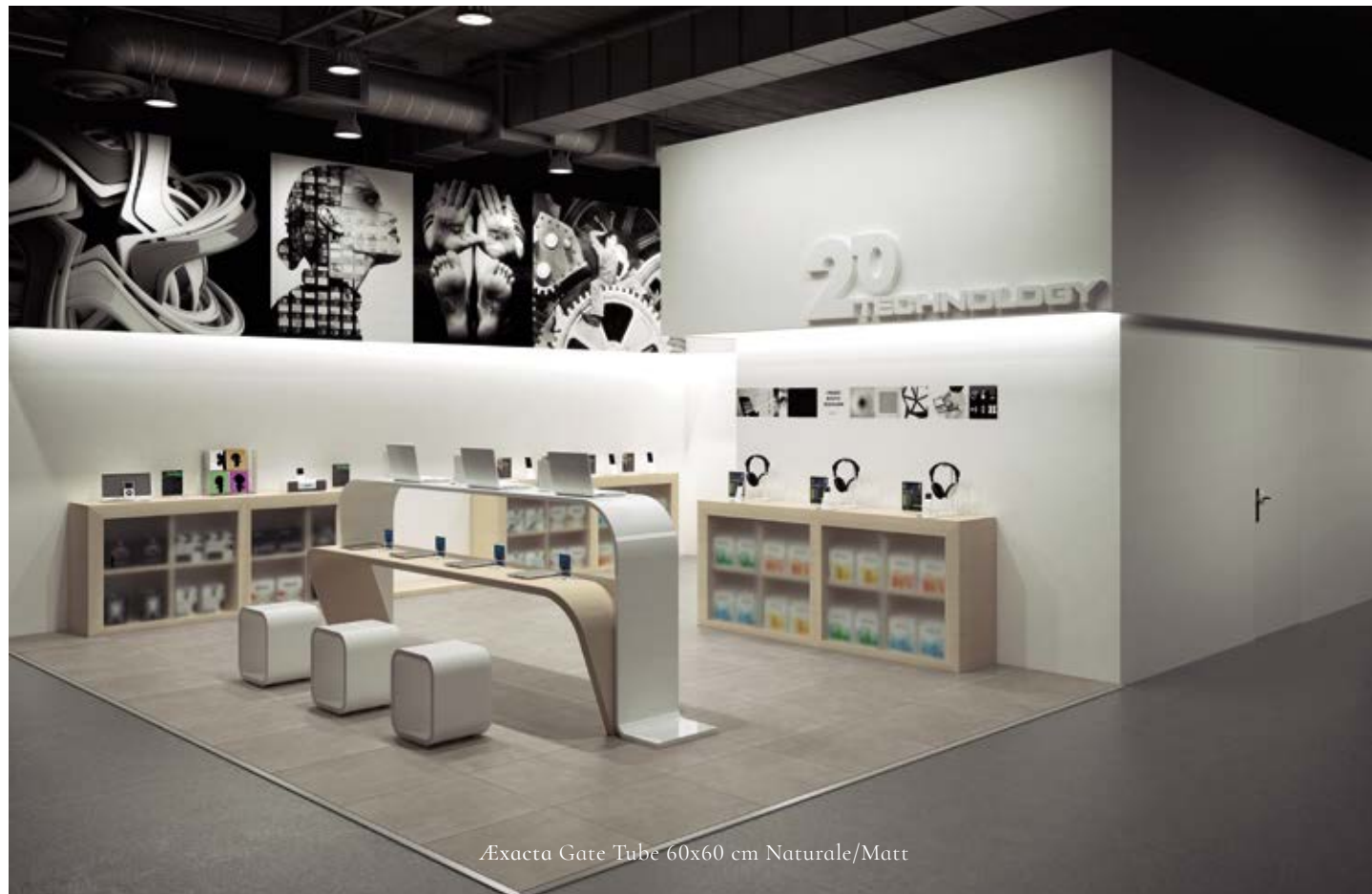
Exacta Gate Tube 60x60 cm Naturale/Matt