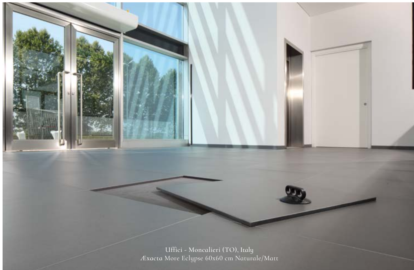
Uffici - Moncalieri (TO), Italy Exacta More Eclipse 60x60 cm Naturale/Matt